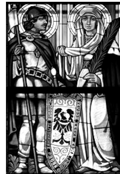
Svatý Václav a jeho babička Svatá Ludmila v kostele svatého Cyrila a Metoděje v Olomouci

Pomoci my tvé žádáme, smiluj se nad námi, utěš smutné, zažeň vše zlé, svatý Václave, Kriste eleison.