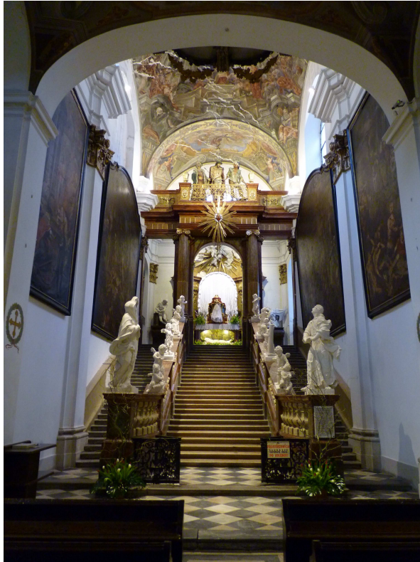
Svaté schody v kostele sv. Janů