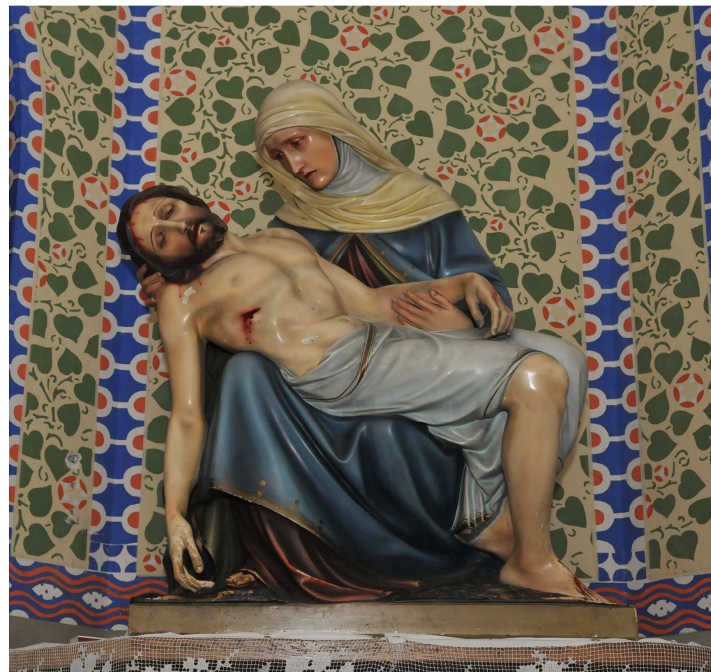
Vedle nesmírně rozsáhlé typové řady Madon, z níž byl prezentován jen opravdu stručný výběr, existovaly od středověku christologické a mariánské

známá i pod názvem Panna Maria pašijová. Malba zobrazuje tzv. druhé zvěstování, kde archandělé Gabriel a Michael ukazují malému, dvanáctiletému Kristu a Matce boží kopí a houbu, kříž a hřeby - předobraz Ukřižování. Pro vznik nových mariánských typů – Assumpty a Immaculaty se zasloužilo zobrazení Ženy sluncem oděné s měsícem pod nohama a s korunou dvanácti hvězd kolem hlavy, představující apokalyptickou ženu z Janova Zjevení, která byla už ve středověku ztotožňována s Pannou Marií. Jedním z nejčastějších vyobrazení vrcholného a pozdního středověku se stala Pieta - truchlící Panna Maria s mrtvým Kristem v náručí.