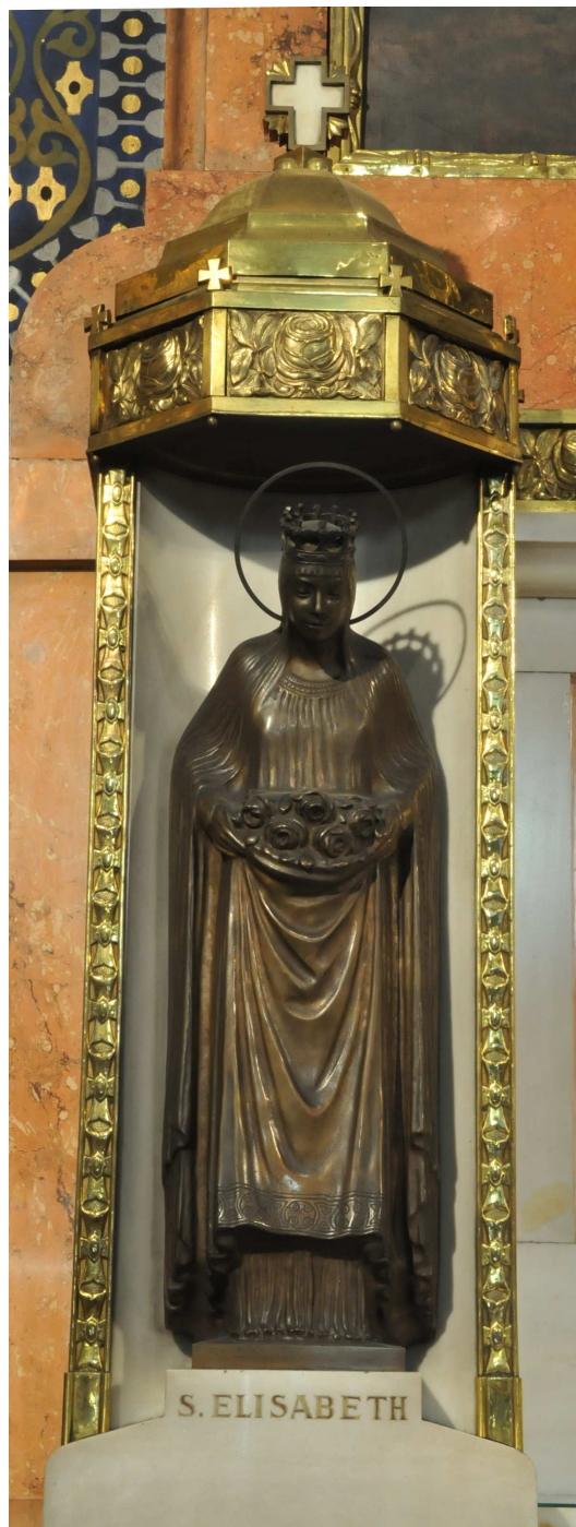
Alžběty Bavorské zvané Sisi. Po atentátu, který byl na císařovnu spáchán v

roce 1222 do Durynska a vyprávěli o skutcích milosrdenství svatého Františka z Assisi. Vévodkyně Alžběta často odcházela z hradu Wartburg mezi chudé a nemocné a podporovala je. O jejich skutcích věděl i manžel, který ji však nebránil. Stalo se, že Alžběta nesla jednou v zástěře chléb chudým. Potkala svého muže, který se jí otázel, co nese. Alžběta rozhrnula zástěru, ale místo chleba bylo v náruči plno růží. V roce 1227 se zúčastnil její manžel na pozvání císaře Bedřicha II. křížácké výpravy s cílem osvobodit Boží hrob. Během cesty se nakazil morem a zemřel. Alžběta po smrti svého muže musela opustit hrad Wartburg, kde nenacházela žádné zastání pro své skutky milosrdenství. Připojila se k III. řádu svatého Františka z Assisi a v Marburku založila z peněz, které jí byly vyplaceny špitál a chudobinec, kde sama pečovala o nemocné. Zemřela v mladém věku, když jí bylo 24 let.